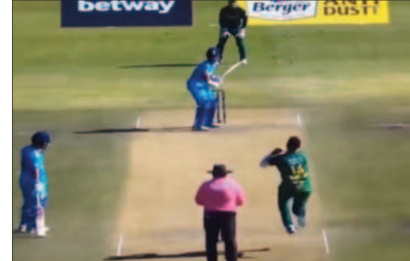
अभियान 29 दिसंबर को अफगानिस्तान की अंडर-19 टीम के खिलाफ शुरू करेगी और फिर दो जनवरी को दक्षिण अफ्रीका अंडर-19 टीम से भिड़ेगी। फाइनल 10 जनवरी को खेला जायेगा। अंडर-19 विश्व कप दक्षिण अफ्रीका के ब्लोमफोर्टन में 19 जनवरी से शुरू होगा। भारत को ग्रुप ए में बांग्लादेश, आयरलैंड और अमेरिका के साथ रखा गया है और टीम अपना अभियान 20 जनवरी को बांग्लादेश के खिलाफ शुरू करेगी।

नई दिल्ली (एजेंसी)। भारत की अंडर-19 टीम अगले साल होने वाले आईसीसी पुरुष अंडर-19 विश्व कप से पहले जोहानिसबर्ग में मेजबान दक्षिण अफ्रीका और अफगानिस्तान के खिलाफ त्रिकोणीय श्रृंखला खेलेगी। भारतीय क्रिकेट बोर्ड (बीसीसीआई) के बयान के अनुसार त्रिकोणीय श्रृंखला जोहानिसबर्ग में खेले जायेगी जिसमें प्रत्येक टीम एक दूसरे से दो बार आमने सामने होगी। भारत की अंडर-19 टीम अपना